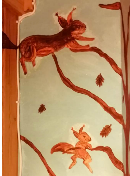
Die Auflösung gabs beim Sankt Martins Kita Gottesdienst: Vorräte teilen.

Was wohl das Eichhörnchen mit Sankt Martin zu tun hat?