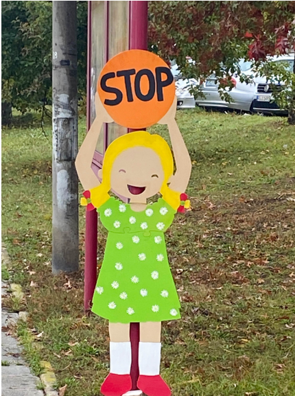
Stopp - hier spielen Kinder. Neues Schild an der Straße vor der Kita.

Was wohl das Eichhörnchen mit Sankt Martin zu tun hat?