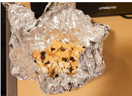
Essensreste im ÖZ - die niemand mehr mag.