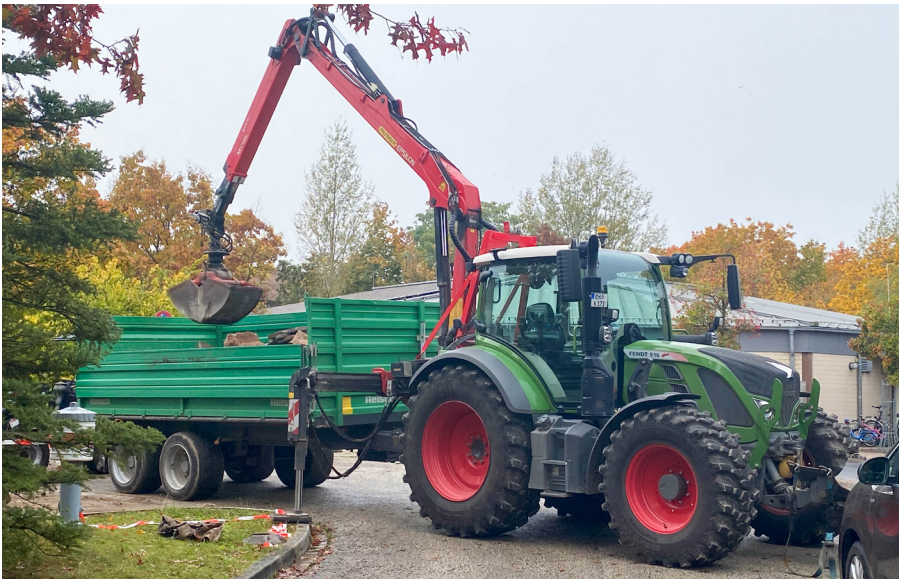
Die Sensation für Kinder. Ein Riesenbagger direkt vor der Kita.