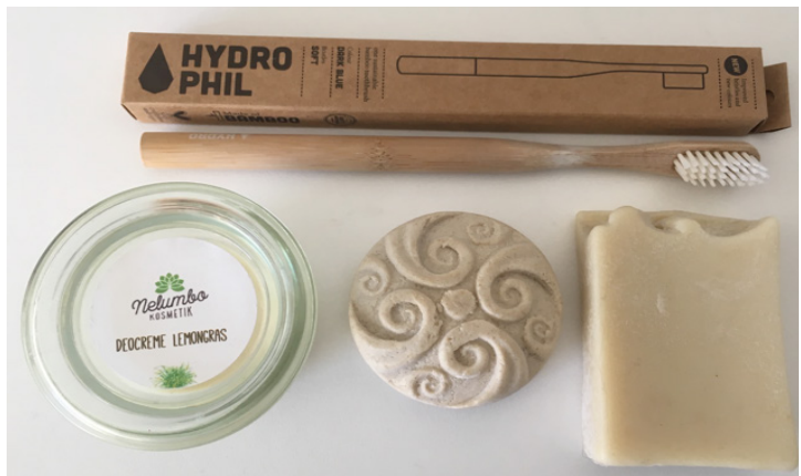
es geht auch ohne Plastik

Das plastik- oder müllfreie Leben wird langsam ein Trend, sodass sich online unzählige Tipps und Ideen finden, wie man seinen Müll reduziert. Der wohl einfachste Schritt bestand für mich aber in dem Wiederaufleben der guten alten Brotbox, ergänzt durch eine wiederauffüllbare Flasche. Klar lässt sich da über das beste Material streiten, aber allein der Verzicht auf die Einweg-Plastikflasche und to-go Varianten sollte meinen individuellen Müllberg schon um einiges reduziert haben.