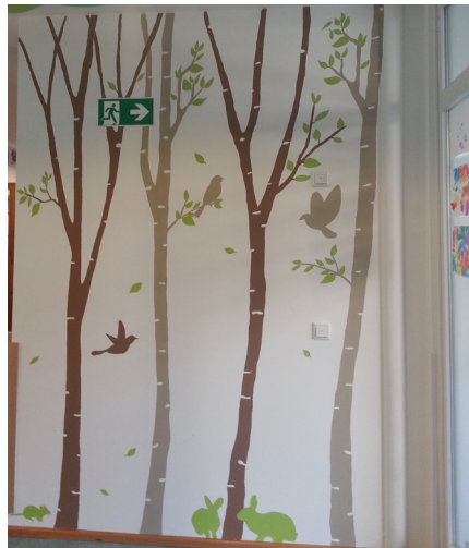
... im schönen neuen Eingang der Krippe

Doch am sinnvollsten ist es, dass Sie einfach selbst einmal hingehen. Der Eintritt kostet 6 Euro – und schon allein das Erinnerungsbuch aus dem 17. Jahrhundert oder der Jakob-Wassermann-Saal sind das Geld wert. Vielen Dank an Michal Käser für einen interessant – leicht und fröhlichen Einstieg in die Museumswelt.