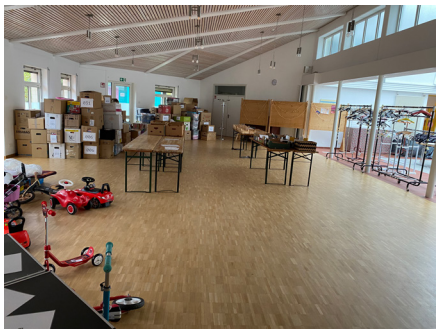
Erst leer, dann voll... dann hoffentlich wieder leer

der Verkauf beginnt. Mütter und Väter gehen sammeln, Kinder erbetteln sich - „Papa, das will ich haben“ - ein Bobby Car und dann geht's nach vorne zur Kasse. Alles wird zusammengerechnet und