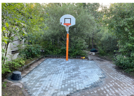
Der fertige Basketballplatz