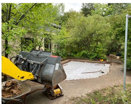
Während des Baus

Nachdem wir den Hügel mit einer wunderschönen Sitzmauer abgestützt haben, bekommt die Kita nun noch einen kleinen Basketballplatz. Firma Reuther baggert, pflastert, verlegt weichen Boden und stellt einen stabilen, kindgerechten Basketball-Korb auf. Mal sehen, vielleicht kommt am Ende ein neuer „Dirk Novitzki“ aus unserer Kita. Wäre ja toll.