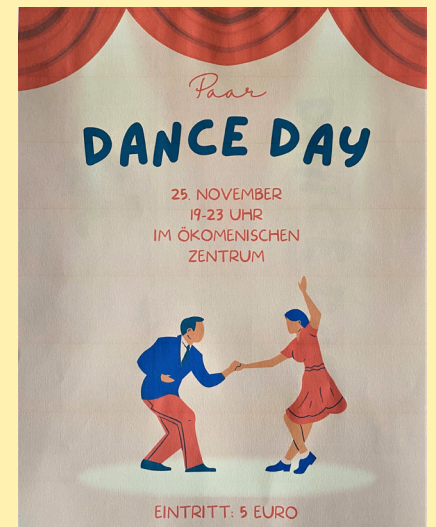
Paar-Tanz-Abend im ÖZ

Am 1. Advent bauen wir wieder den Adventsmarkt auf. Und wie bei der Bücherecke im ÖZ gibt es auch hier wieder einen „Leg Hin – Nimm mit“ Tisch. Wenn Sie also beim Schmücken für den Advent Schönes aber für sie nutzloses entdecken gerne dorthin legen. Und bei der Gelegenheit vielleicht gleich schöne Karten, leckeres ÖL, Likör oder eine Tüte Kekse kaufen. Der Erlös ist für die Orgel – die zwar schon steht aber noch nicht ganz abbezahlt ist.