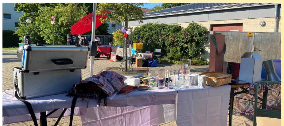
Hofflohmarkt am 9.9.23 – Wir waren dabei!