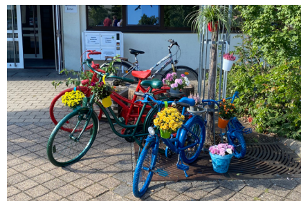
Die ersten Räder sind fertig!