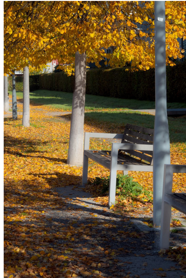
Herbst im Südstadtpark

Paar-Tanz - Abend im ÖZ am Samstag 25.11.2023, 19 - 23 Uhr; Eintritt 5 Euro