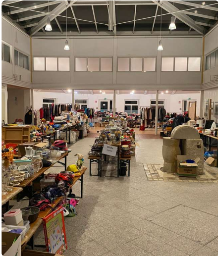
Der Ukraine Markt