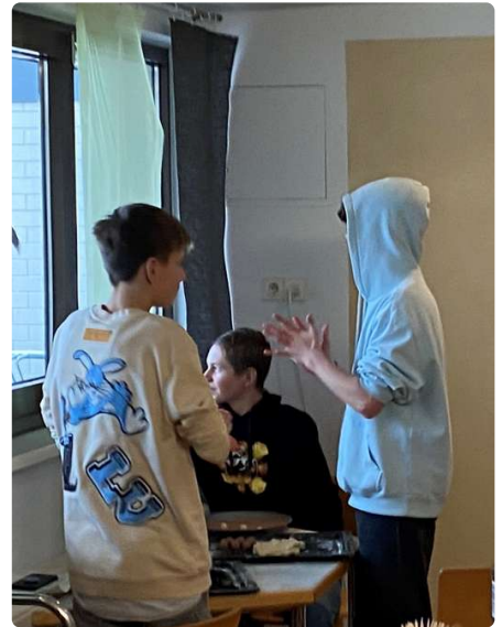
Die Jungs kneten