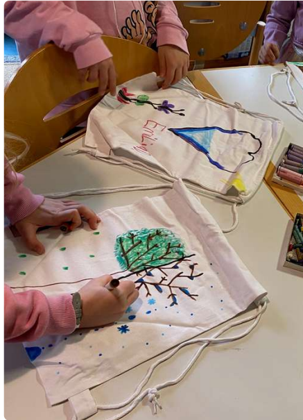
Turnbeutel werden bemalt

...am Buß- und Betttag. Tolle Kinder, tolles Team, sowohl in der Küche als auch bei den Gruppen. Es hat viel Spaß gemacht. 2024 gibt's wieder einen KIBITA. Dieser Schatz soll nicht verloren gehen. Doch eventuell feiern wir den nächsten KIBITA südstadtweit zusammen mit St. Paul. Wäre doch klasse! Save the Date! Oder einfach: bitte im Kalender vormerken.