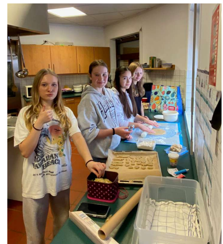
Die Mädchen backen die Plätzchen