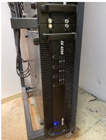
Die defekte Endstufe

Das war wirklich unheimlich. Denn plötzlich und immer dann, wenn ich es jemandem zeigen wollte, war alles wieder still. Zum Glück kam schnell der Fachmann, überprüfte alles und stellte einen Schaden an der Endstufe fest. Ruck-Zuck war die dann ausgetauscht. Jetzt brazzelt nichts mehr. Wunderbar.