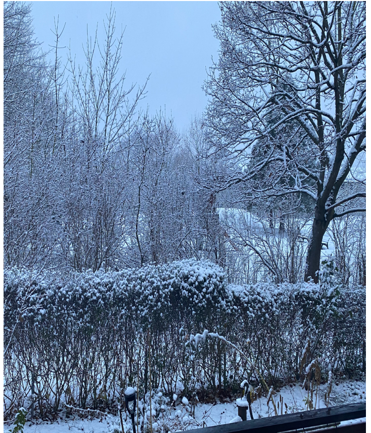
Blick aus dem Fenster im Winter

Bitte informieren Sie sich über die Aushänge oder im Internet: www.maria-magdalena-fuerth.de