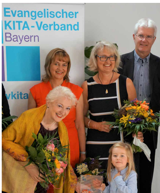
Verleihung des ev. KITA Awards im ÖZ

Der evangelische KITA-Verband Bayern hat den evKITA-Award ins Leben gerufen. Er wird an Politikerinnen und Politiker vergeben, die sich für die Belange der Kitas in besonderer Weise einsetzen.