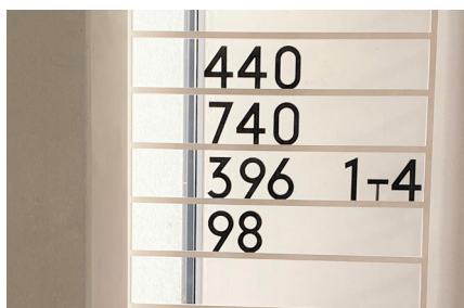
Liednummern aus dem Gottesdienst

Nein. Texte, Botschaften, vertraute Lieder. Die Liednummern des Gesangsbuches bleiben stehen. So kann jede/r nachschlagen, was die Gemeinde am Sonntag gehört hat und - falls man alleine in der Kirche ist - vielleicht ein wenig für sich selbst singen.