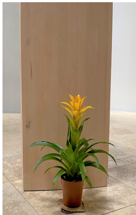
Guzmania vor dem Taufstein

Der tolle Weltgebetstagsgottesdienst blieb noch lange in Erinnerung durch die herrlichen Pflanzen in unserer Kirche.