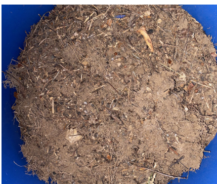
„Gewusel“ in der „Umzugstonne“