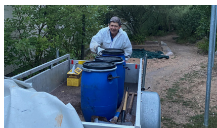
Die „Umzugstonnen“ werden an den neuen Ort gebracht