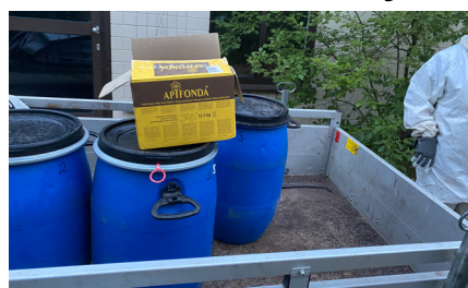
Der Anfütterzucker: so können die Ameisen sich im neuen Zuhause einrichten - ohne gleich auf Futtersuche zu müssen.